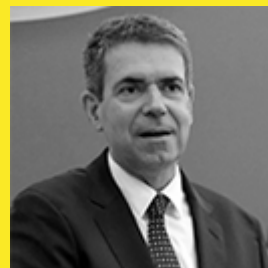
Δημοσθένης Αναγνωστόπουλος Secretary General for Information Systems and Digital Governance